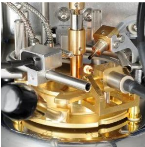
PM-93 Medidor del punto de inflamación Pensky-Martens

Se introduce una muestra de ensayo en un recipiente calefactado provisto de una tapa. Se sumerge una fuente de ignición a través de la abertura de la tapa en el espacio de vapor situado sobre la muestra calefactada y se comprueba si el vapor se enciende (destelló "Flash") a la temperatura medida de la muestra.